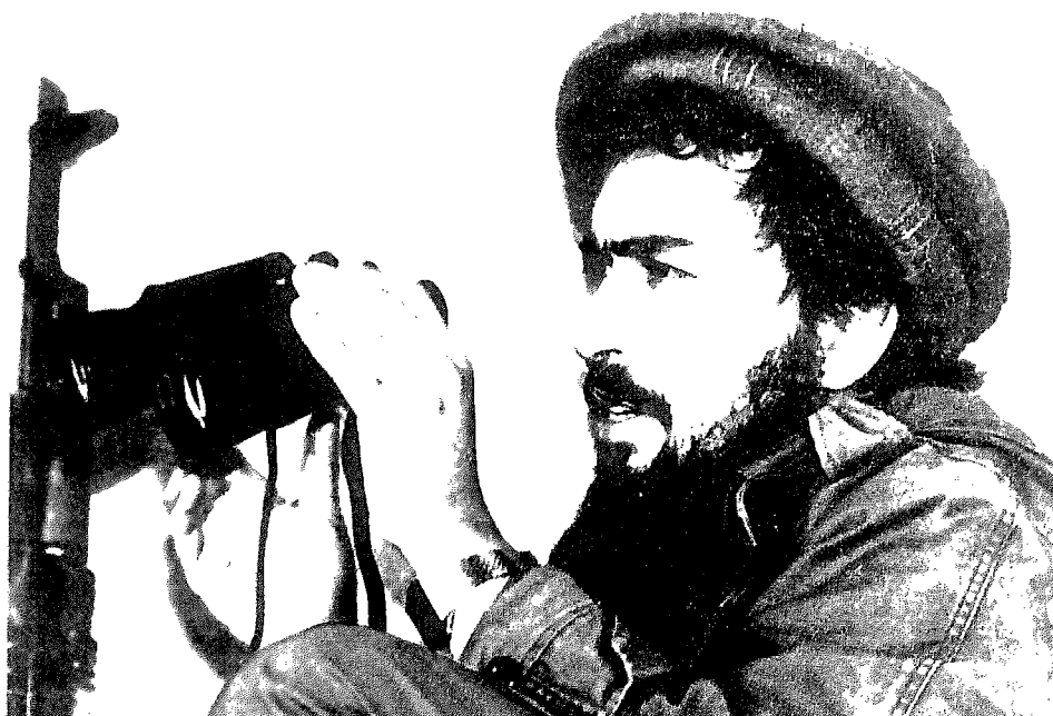
ذبيح الله أمير ولاية مزار الشريف .